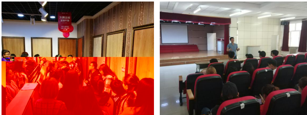
图 4 共享型实 基地

(四) 共建共享实 基地。双方共同投入 建 共享实 基地，“共用共管” 源使用率大大提 。