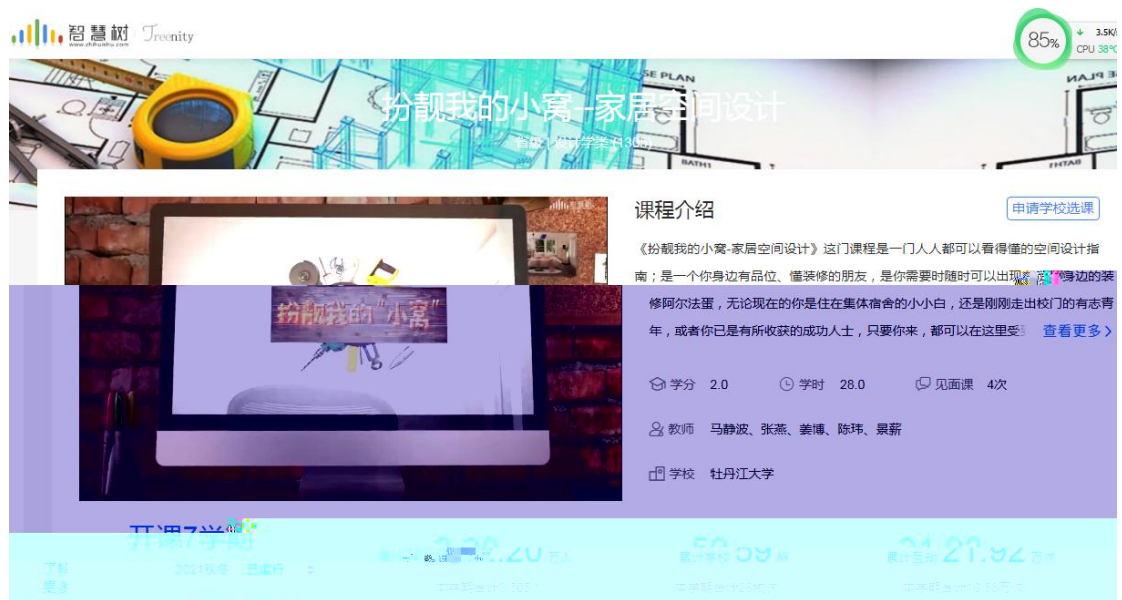
图 5 扮靓我的小窝在线课程

2018-2019 年校企师傅共建《扮 我的小窝》在线 程， 程 2019 年为省级精品在线开放 程，并在智慧树平台上线，学生对有丰富实 的企 业师傅参与授 的在线 程 常欢 ，授 程学生既 听到学校 师 幽 的理 知 传授，也 得到企业师傅扎扎实 技 的指导。