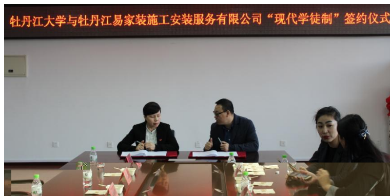
图 1 牡丹江大学与企业签约仪式

（一）校企共研招生招工模式。双方 各 站发布招生招工一体化及 点班班 信息，在新生入校后组织宣 、 核方式成立 点班，明确 点班学员双 份，建立末位淘汰机制；签 “校企生”三方协 ， 一步明确三方权 。