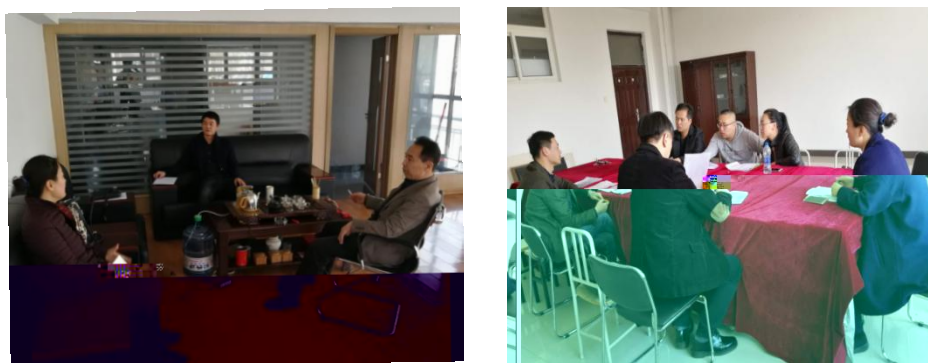
图 2 与企业商讨人才培养目标

(一) 共同 专业人才培养方案。根据学徒岗位 求，校企 合 学生 在学校和企业的学习内容、教学安排、教学形式和教学方法等环 ， 点工 作实 ，不断优化教学安排和教学手段。