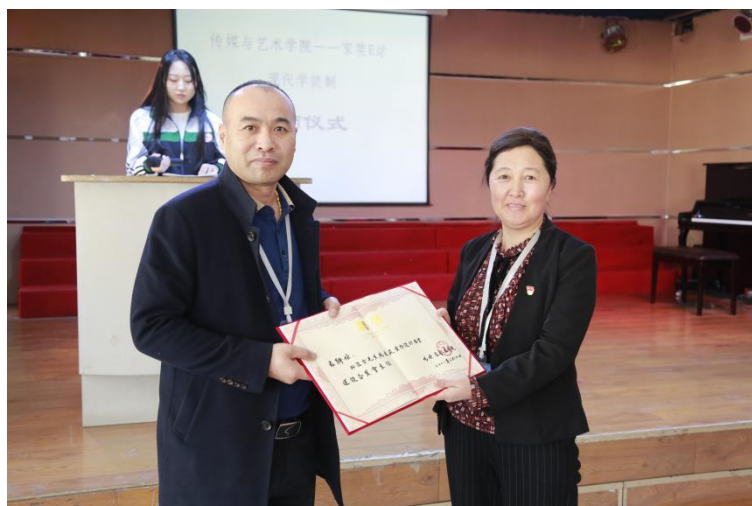
图 6 建筑室内设计专业拜师仪式领导合影

2019 级建筑室内 专业提出申 的 40 名学生 家 站开展了企业实 活动，分别 入了市场 ， ，施工 等相关工作岗位开展了 岗实 。