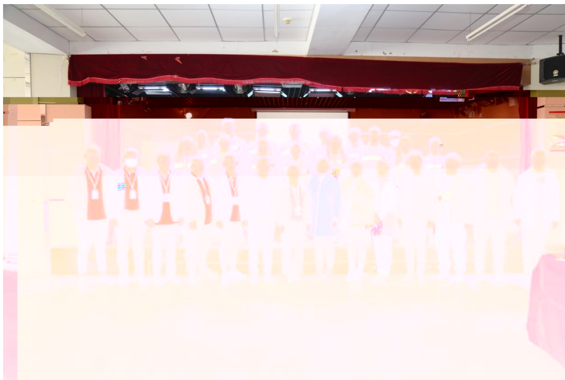
图 7 建筑室内设计专业拜师仪式师生合影

2019 级建筑室内 专业提出申 的 40 名学生 家 站开展了企业实 活动，分别 入了市场 ， ，施工 等相关工作岗位开展了 岗实 。