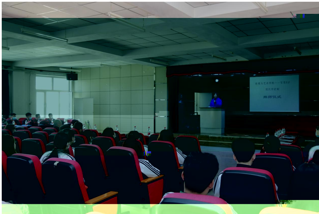
图8 建筑室内设计专业拜师仪式领导讲话

波对上一段“现代学徒制”作了实的总 并深刻剖析现代学徒制学习方式，同时对19级学生的程制、学生管理、疫情控等方作了具体的安排。孙 和企业师傅代 对学生在企业工作、学习、生活、定及企业文化等方 。 处 从校企合作教 教学为切入点，对“现代学徒制”的教学管理提出了新的 求。